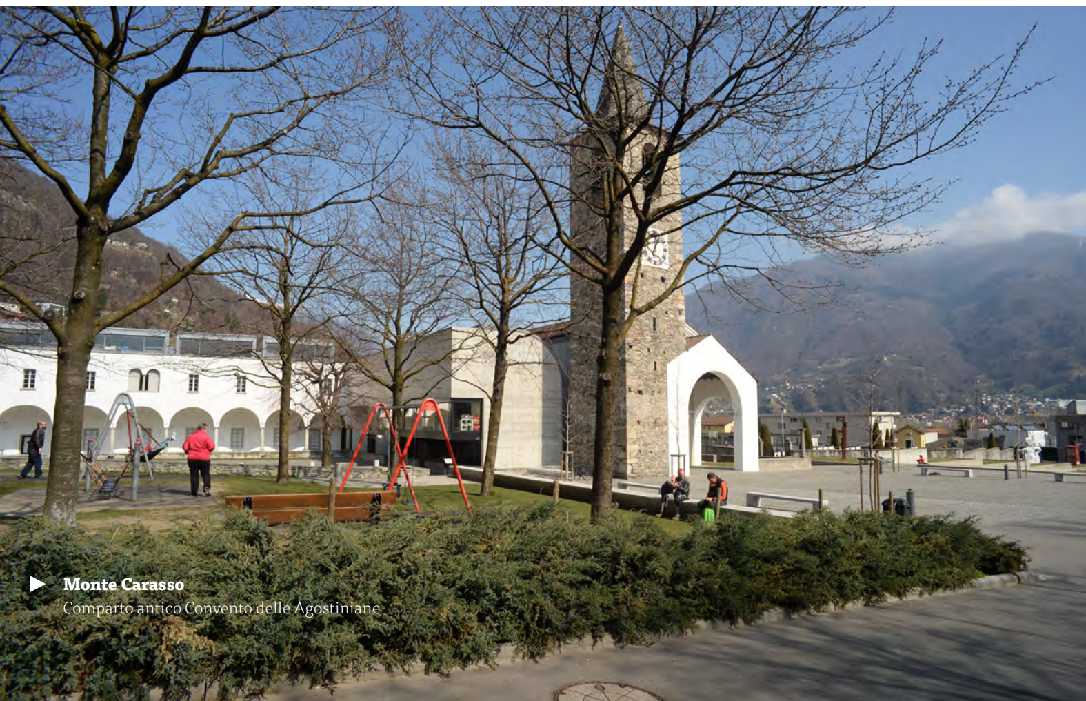
► Monte Carasso Comparto antico Convento delle Agostiniane