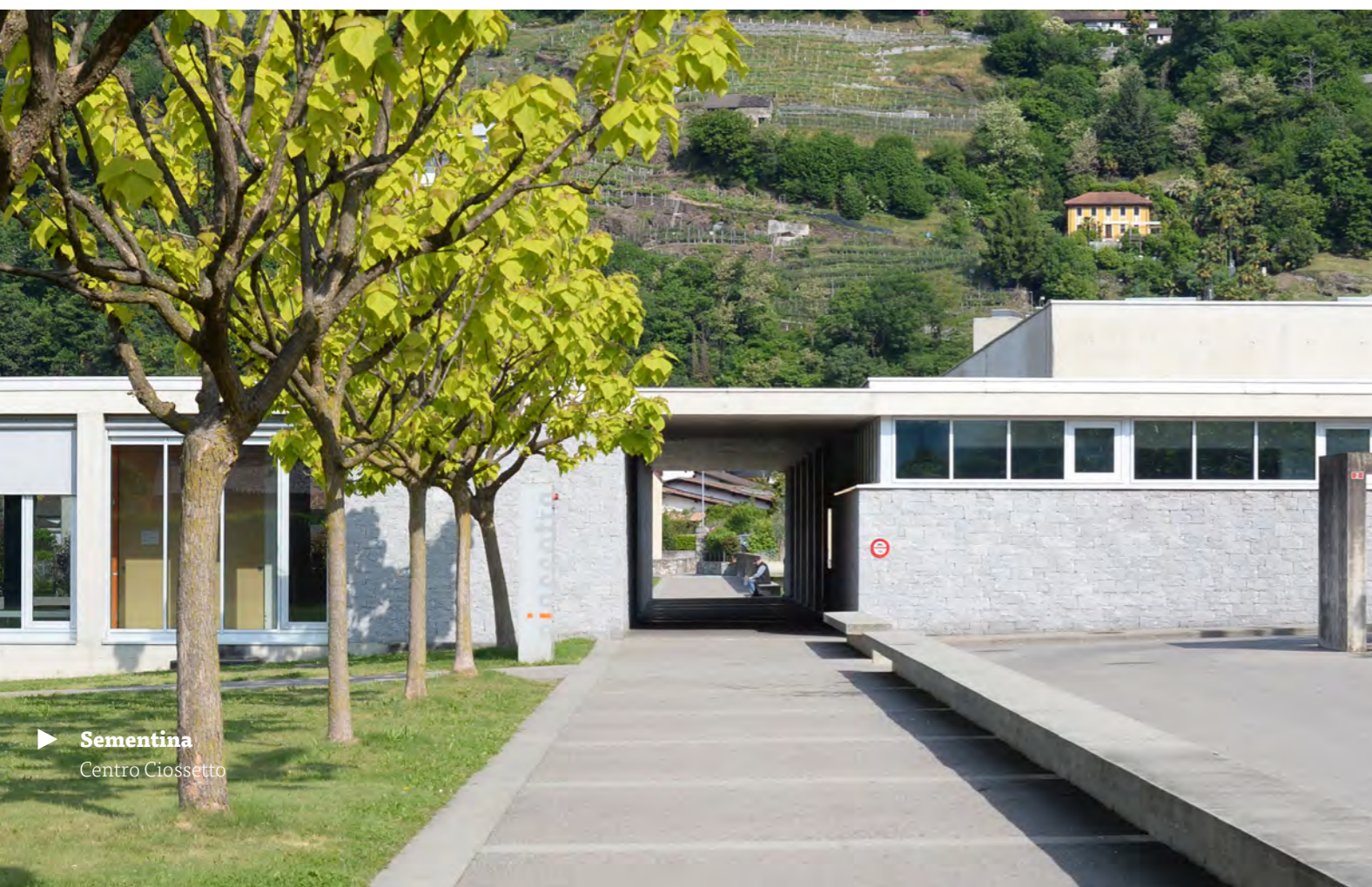
► Sementina Centro Ciossetto