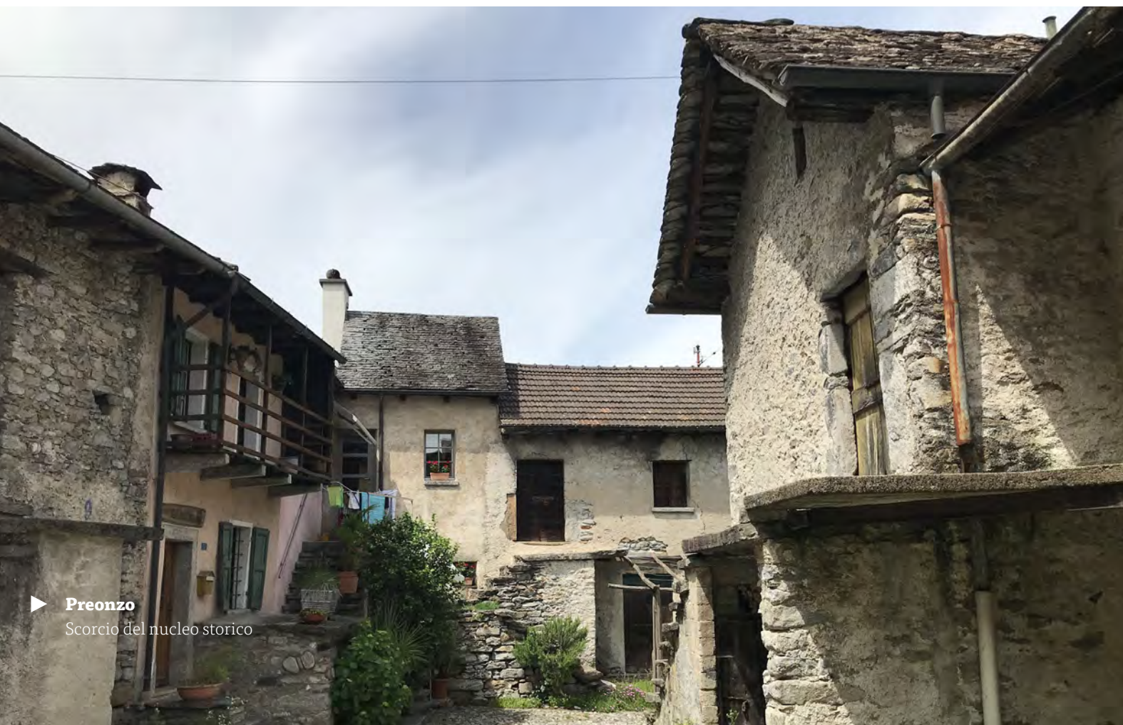
► Preonzo Scorcio del nucleo storico