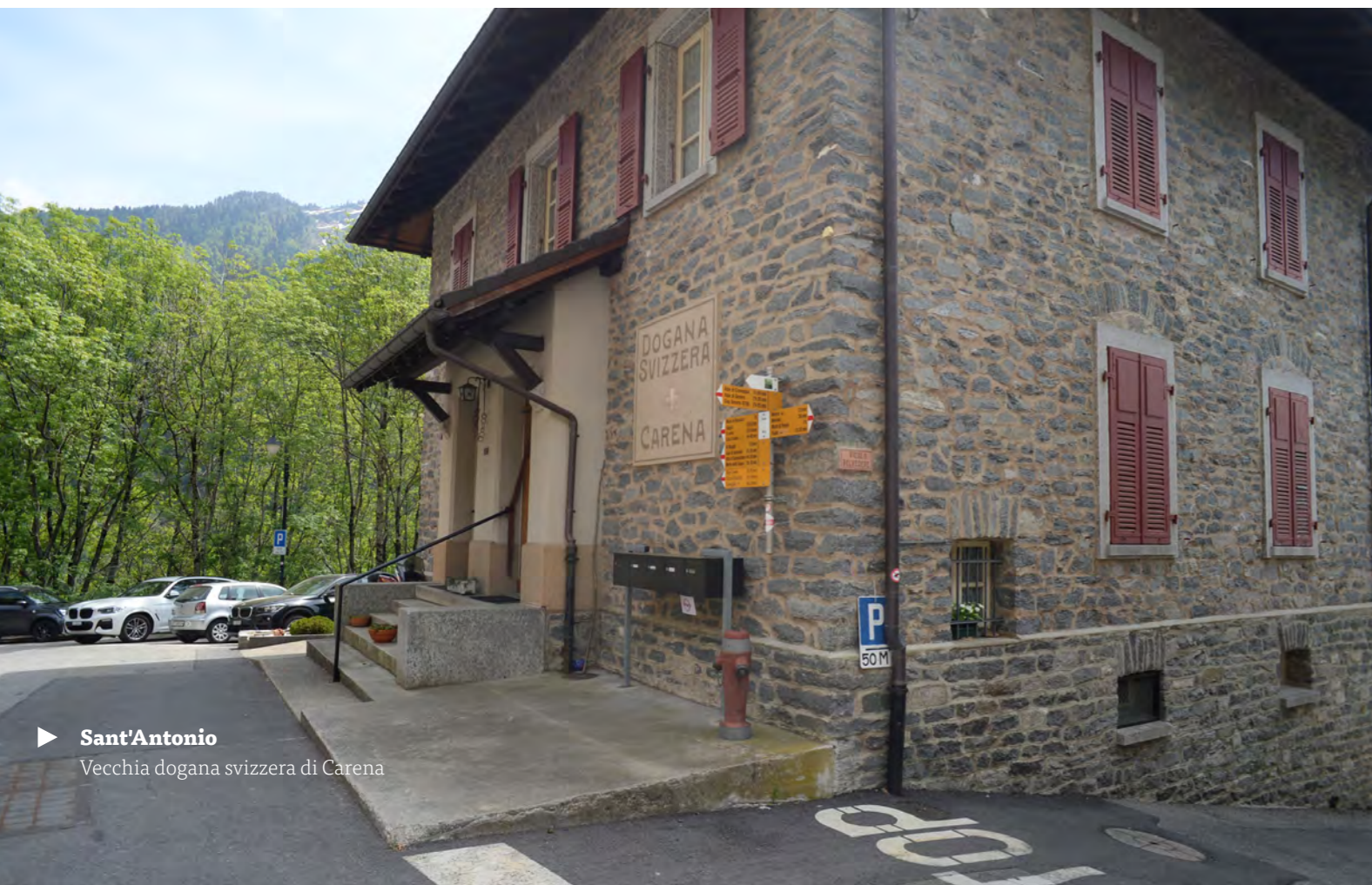
▶ Sant'Antonio Vecchia dogana svizzera di Carena